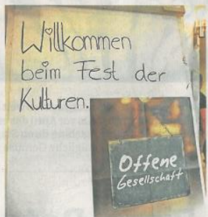
Tanzen, musizieren, ratschen: Das Fest der Kulturen in Ottobrunn hat wieder eine Vielzahl von Gästen angelockt. Sie wurden von vielen verschiedenen Gruppen bestens unterhalten.